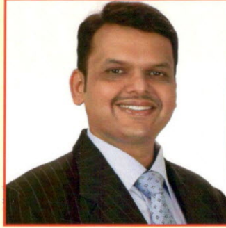
मा. श्री. देवेन्द्र फडणवीस मुख्यमंत्री